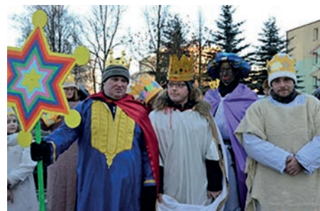
Képek a lengyelországi Három Királyok felvonulásról